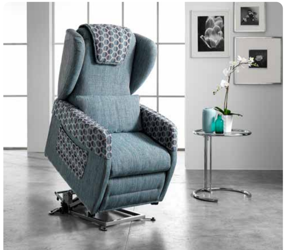
MECCANISMO DI ALZATA FACILE