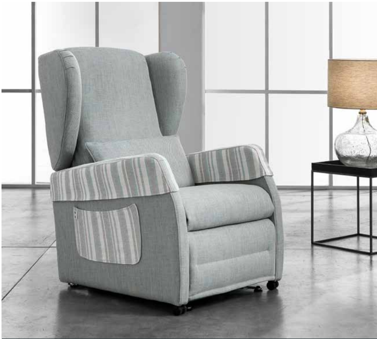
POLTRONA "CLASSICA" IN VARIANTE COLORE